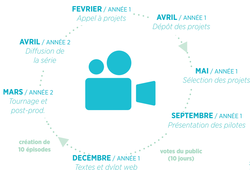
FIG W-2 : Agenda de l'appel à projets « webséries » 2016

Tout créateur peut soumettre un projet de fiction conçu spécifiquement pour une diffusion sur internet.