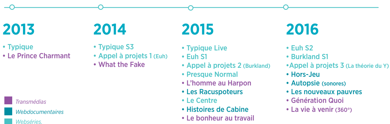
FIG W-1 : Ligne du temps des webcréations